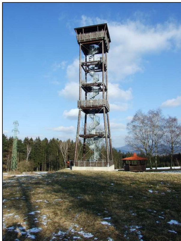
Rozhledna Na Signálu