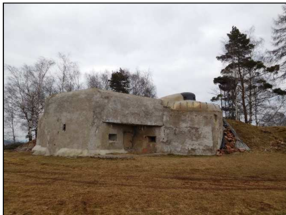
Opevnění u rozhledny Signál